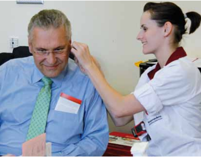
Ein offenes Ohr für das Thema Blutspenden: Innenminister Joachim Herrmann geht mit gutem Beispiel voran.