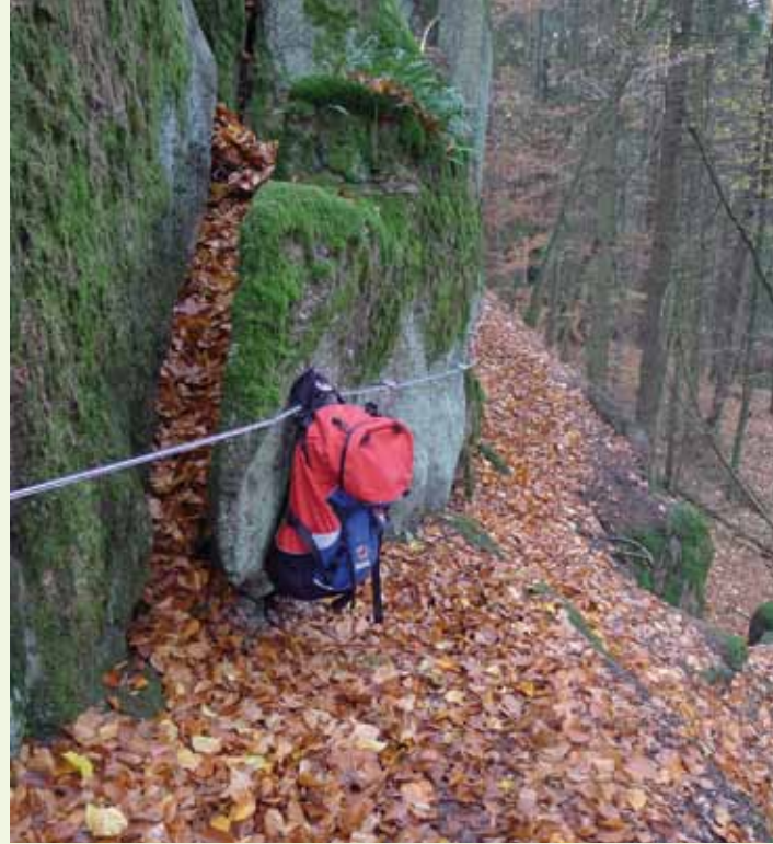
Unter dem „Wilder Mann“.

ren Wanderern vorbehalten. Geologisch und erdgeschichtlich Interessierte können hier die Entstehung des Bayerischen Waldes nachvollziehen. Nach diesem herrlichen Abstecher in die Erdgeschichte steigen wir weiter abwärts und wenden uns beim nächsten Querweg nach rechts, wo wir bei einem Bach auf die Markierungen rotes und grünes Rechteck treffen (Pkt. UQ 07634871). Ab hier folgen wir der roten Markierung aufwärts und dem Weg Nr. 48, der uns über das Naturdenkmal Pfaffenstein, Höhe 519 m (Pkt. UQ 07634953), führt. Diesem Weg folgen wir bis zu einer Forststraße, in die wir nach rechts einbiegen. Zuerst in östlicher, dann in nördlicher Richtung wandern wir auf diesem Forstweg, im Ort Linden rechts haltend, hinab in das Regental. Ab Linden sehen wir schon die Kirche mit dem ehemaligen Kloster Walderbach, welches heute das Kreismuseum beherbergt. Regenaufwärts ist noch zu gehen, bis wir den Regen überqueren können und den Ort Walderbach erreichen. Die Klostergaststätte ist immer offen und lädt uns zu der verdienten Mittagsrast ein. Der Rückweg führt uns auf bekanntem Weg über Linden bis zu der Hinweistafel bei Pkt. UQ 07744994. Hier verlassen wir den breiten Weg und folgen dem bezeichneten Wander-