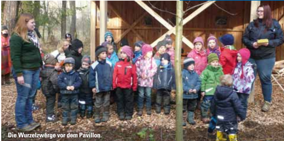
Die Wurzelzwergel vor dem Pavillon.

Viele Helfer bauten am Pavillon für den Waldkindergarten