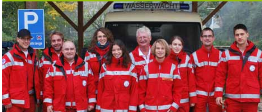
Die am Einsatz beteiligten Helfer der Wasserwacht.

Die Mutter kann sich selbst aus dem Fahrzeug befreien, ihr Sohn geht mit dem Auto unter. Ein Angler kümmert sich um die Frau, zwei Kanuten orten das Fahrzeug, ein vorbeifahrender Motorradfahrer setzt sofort den Notruf ab. Durch die ILS Regensburg wird auch die Wasserrettung alarmiert. Einsatzkräfte der umliegenden Feuerwehren können den Jungen nicht befreien. Ein Helfer der Wasserrettung Regensburg (ein Kamerad der DLRG) taucht unverzüglich nach seinem Eintreffen zu dem Jungen ab und kann ihn befreien. Zwanzig Minuten nachdem