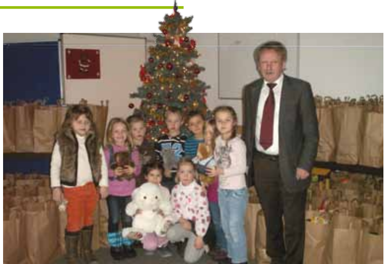
Die Kinder des St. Barbara-Kindergartens Hemau folgten der Einladung.

Die Bereitschaftsjugend in Hemau konnte dieses Jahr sogar über 600 Kilogramm Lebensmittel sammeln (siehe Bericht unten). Ebenfalls mit großem Erfolg beteiligte sich der integrative BRK Kindergarten St. Barbara in Hemau; die Kinder kamen deshalb stellvertretend für alle Beteiligten, denen großer Dank gilt, zum Pressetermin am 3. Dezember in die Geschäftsstelle.